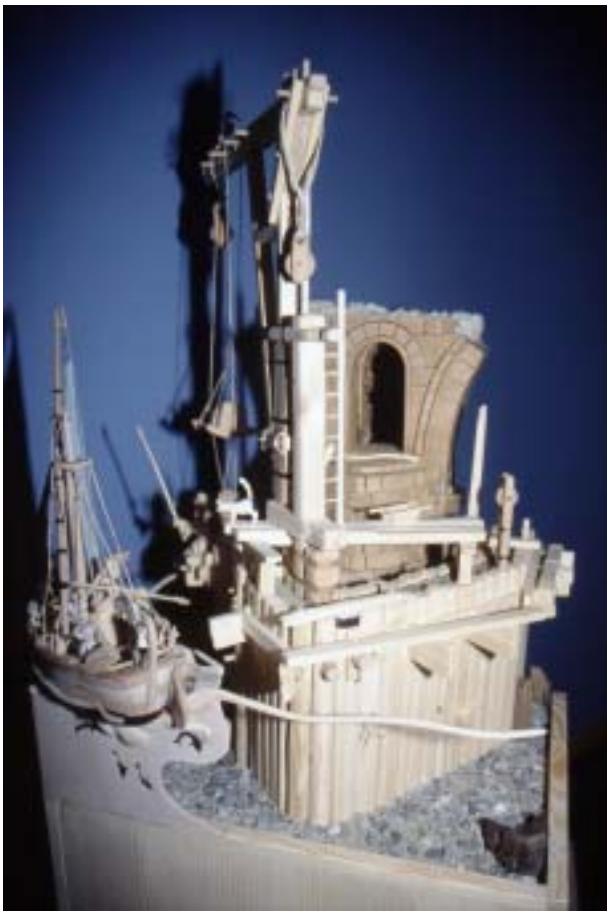
Abb. 2: Brückenpfeiler mit Spargewölbe - von der Oberwasserseite aus gesehen - Bauzustand

Beim Bau der Umgehungsstraße von Bad Zuzach 1985/1986 wurden zahlreiche hölzerne Gründungspfähle die mit schmiedeeisernen Spitzen versehen waren aus dem Rheinbett geborgen. Sie stammen teilweise von der römischen, teilweise von einer mittelalterlichen Brücke. Die römische Brücke wurde im Zuge der Fernstraße von Rom nach Rottweil ungefähr 368-376 n. Chr. erbaut.