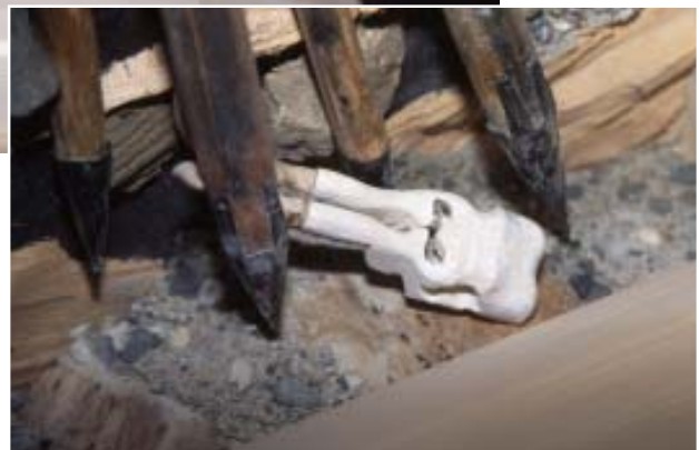
Abb. 3: Schnitt durch den Pfeiler einer großen römischen Brücke (Modell)