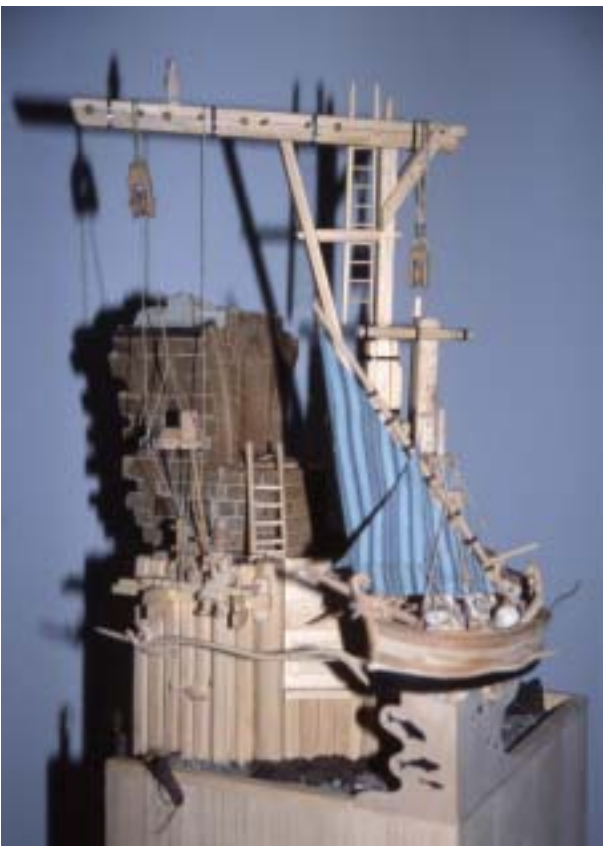
Abb. 5: Kran und Schiff

1987 - Nachdruck der Ausgabe 1920, ISBN 3-925037-06-3.